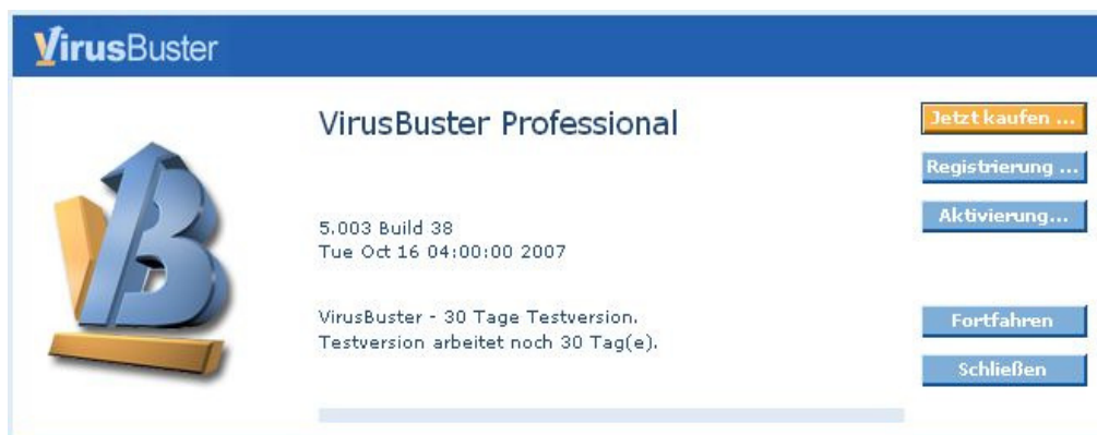
Nicht registriertes Produkt – Warnfenster

Es erscheint das VirusBuster- Auswahlfenster. Wählen Sie nun Aktivierung . Hierfür ist eine Internetverbindung erforderlich.